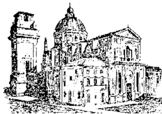
San Giorgio in Braida